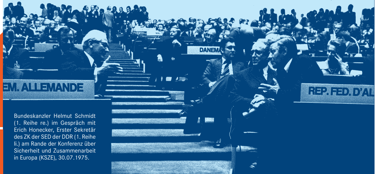
Bundeskanzler Helmut Schmidt (1. Reihe re.) im Gespräch mit Erich Honecker, Erster Sekretär des ZK der SED der DDR (1. Reihe li.) am Rande der Konferenz über Sicherheit und Zusammenarbeit in Europa (KSZE), 30.07.1975.

Zudem verpflichteten sie sich, die Prinzipien der pluralistischen Demokratie und der Rechtsstaatlichkeit einzuhalten sowie die Achtung der Menschenrechte und Grundfreiheiten zu gewährleisten.